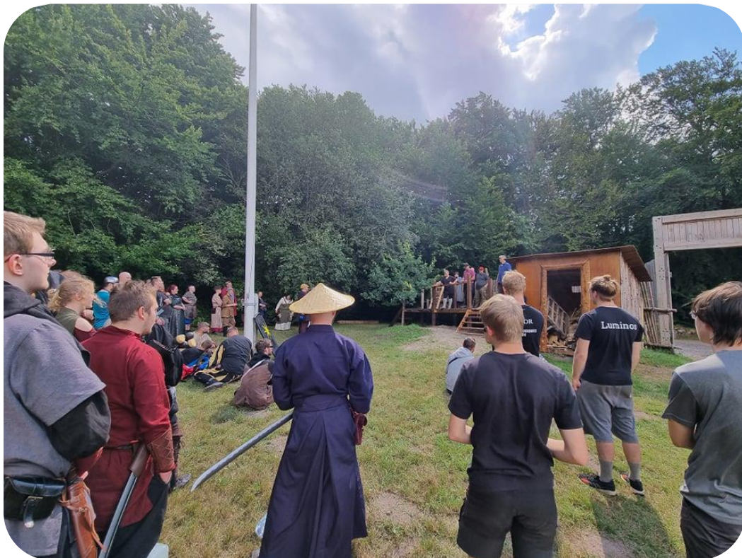
Briefing august spilgang 2021.